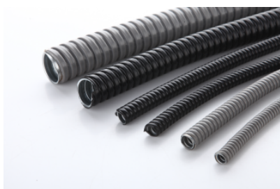
MCR型金属软管 Metal Flexible Conduit