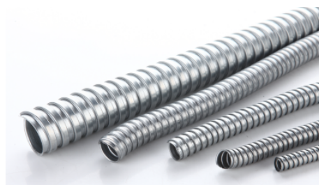
MC型金属软管 Metal Flexible Conduit